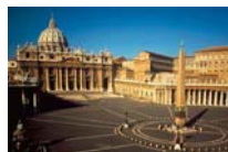
Desde Roma Por José Luis Perucha