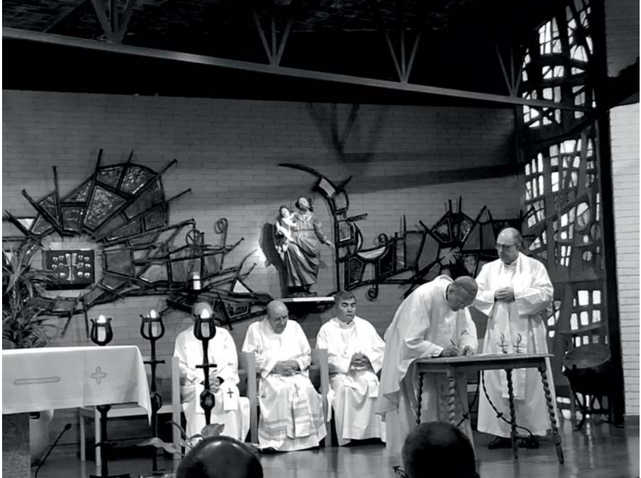
Otra imagen de la firma por parte del obispo de las decretales sinodales, en la capilla del seminario San José y colegio diocesano Cardenal Cisneros de Guadalajara.