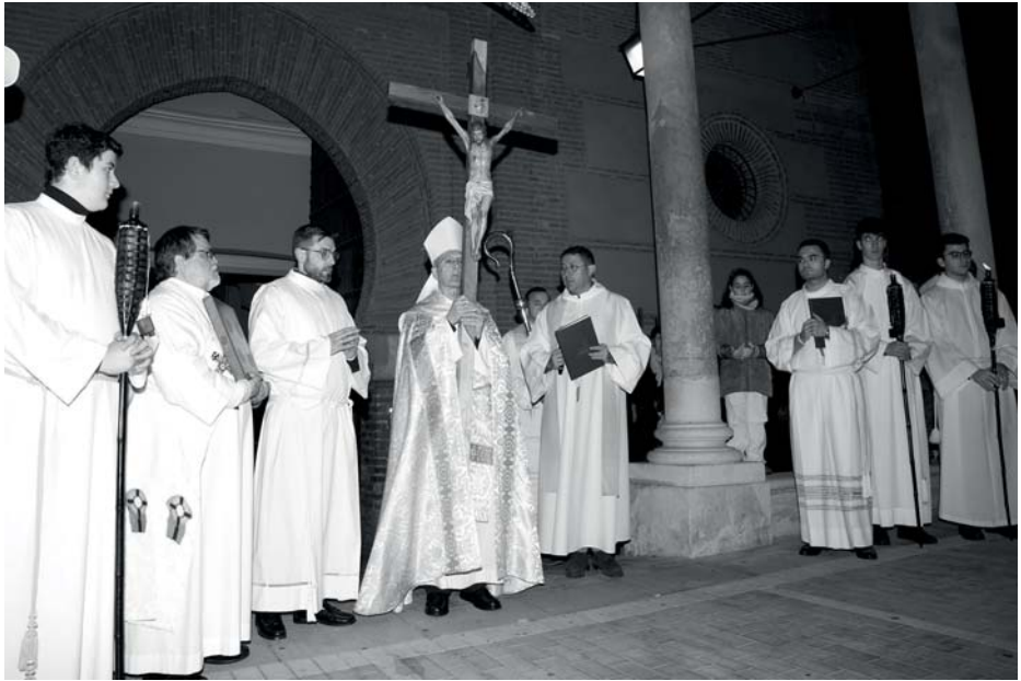
Apertura del Jubileo en la concatedral de Guadalajara