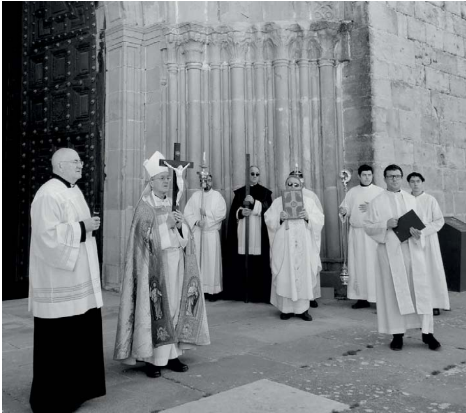
Apertura del Jubileo en la Catedral de Sigüenza