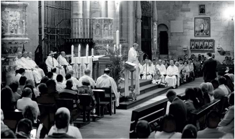
Al final de la misa de clausura del sínodo diocesano, se leyó el mensaje final del sínodo.