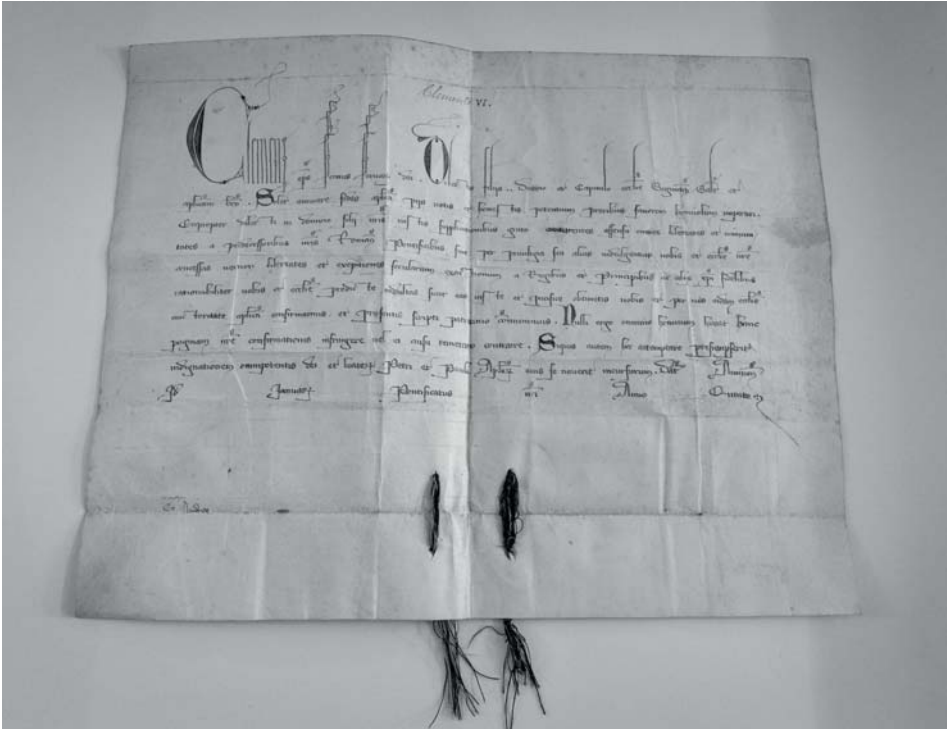
Bula del Papa Clemente VI de 1346, restituida a la catedral