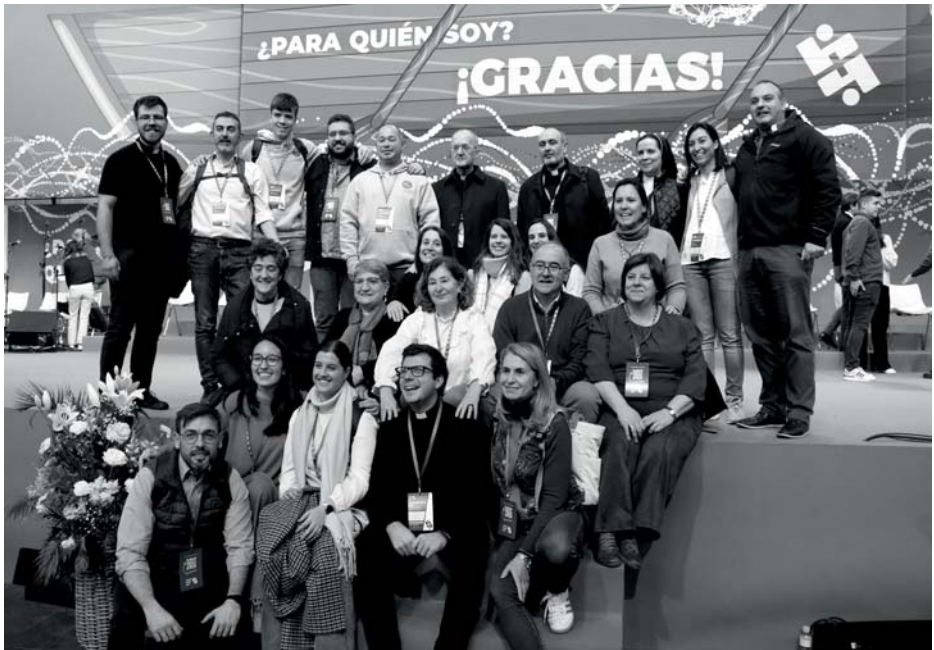
Participación diocesana en el Congreso Nacional de vocaciones