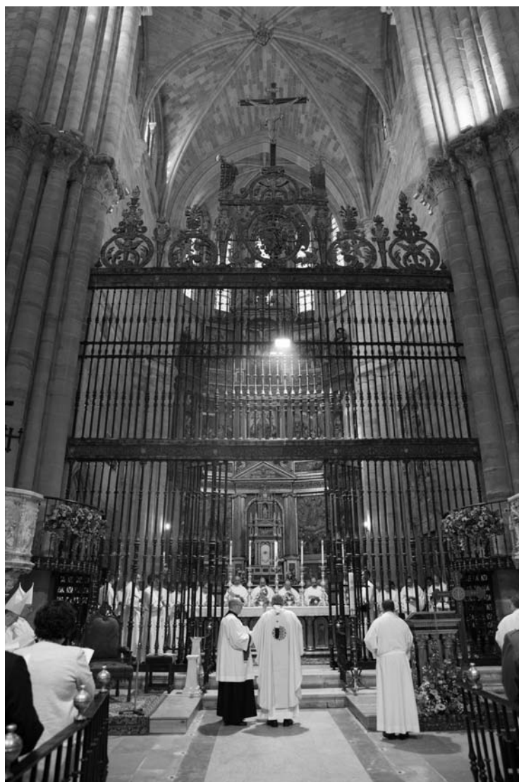
Imagen de la misa en rito hispano-mozárabe con la que fue clausurado, el domingo 16 de junio de 2019, el Año Jubilar de la Catedral de Sigüenza, del que ofrecemos un amplio dossier al final de este número del Boletín Oficial del Obispado.