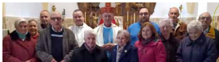
Parroquia de Semillas, viernes 29 de diciembre. Doce fieles y el párroco acogen al nuevo obispo.